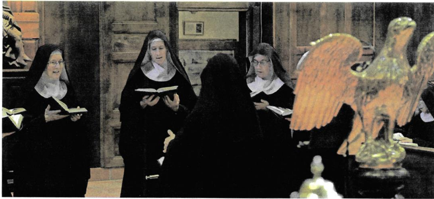
Ein himmlischer Segen liegt über diesem Projekt: Seit einem Jahr werden die gesungenen Gebete in der südfranzösischen Abtei Jouques aufgenommen.